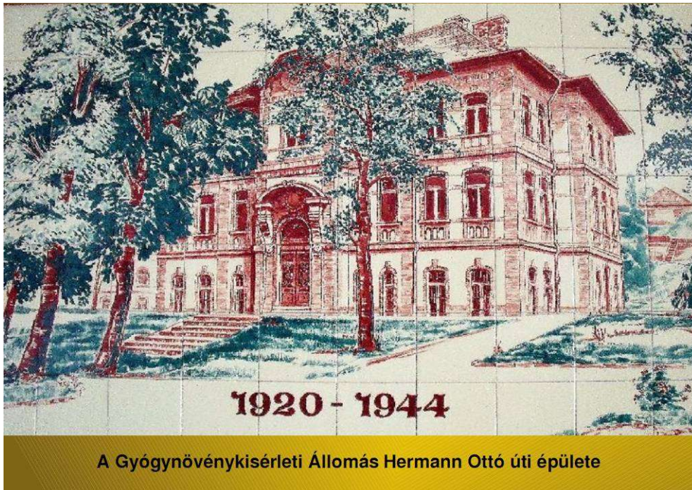
A Gyógynövénykísérleti Állomás Herman Ottó úti épülete (1920–1944)

Augustin Béla irányításával kezdődött meg a magyar gyógynövényügy gyakorlati és tudományos megalapozása, a gyógynövényminősítési rendszer kialakítása, bevezetése és elismertetése, a hazai gyógynövénykutatás elindítása és európai színvonalúvá fejlesztése.