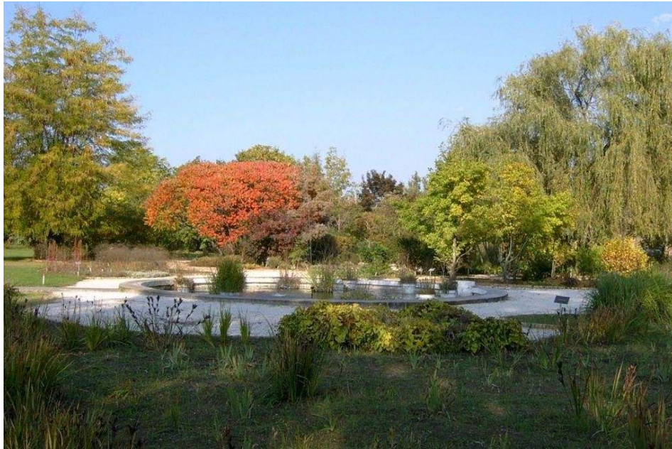
A Kemotaxonomiai Botanikus Kert