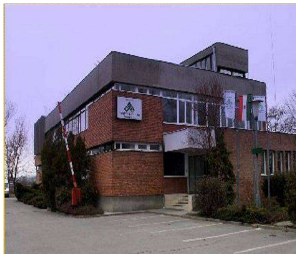
A Gyógynövény Kutató Intézet budalászi kutatóközpontja