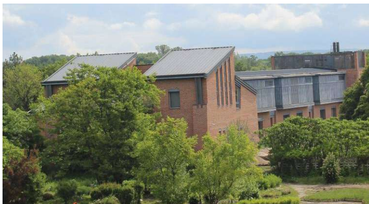
A Gyógynövény Kutató Intézet GMP konform Gyógyszergyártó Üzeme

A 2004-ben megvalósult GMP konform új Gyógyszergyártó Üzem az intézeti erőforrások legstabilabb pillére lett.